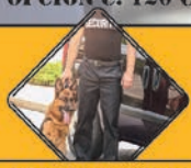
Vigilancia con perros Prácticas reales con perros en Club Canino Alcoray