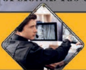
Vigilancia en polígonos urbanizaciones, espacios públicos y transportes