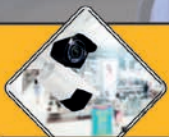
Vigilancia en centros comerciales