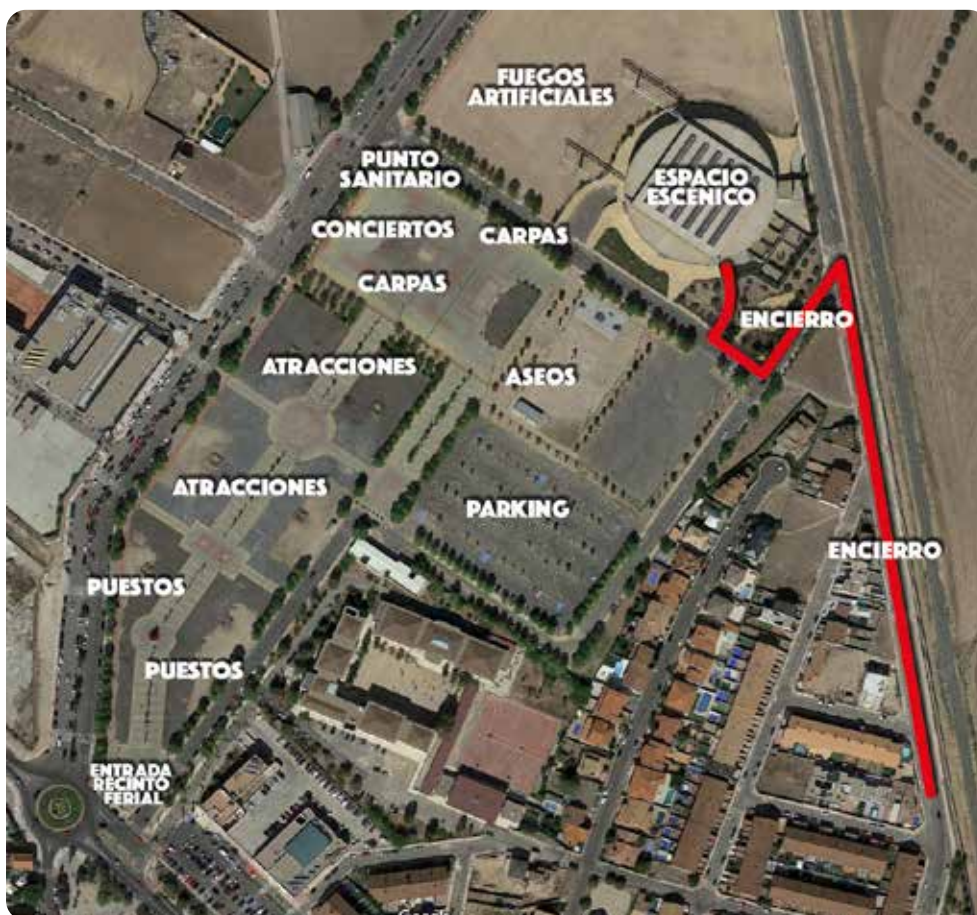
PLANO DE SITUACIÓN • Recinto Ferial